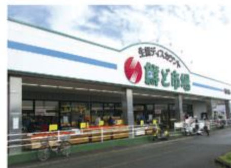
■鮮ど市場 飛田店 全景