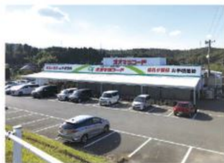
■オオマツフード 笠原店 全景

オオマツフードは地元密着型の「お客様との距離」に最もこだわっているスーパーマーケットである。常にお客様に喜びと感動、買い物の楽しさを提供する為に「明るい笑顔」「親切な対応」「小さな気配り」で、顔馴染みのお客様には毎日通い、地域の方々が集まるコミュニティとしても愛されている。そして生鮮食品はどれも新鮮でお手頃価格と好評である。チラシの他、金曜日はお肉、日曜日は玉子のように曜日ごとにお値打ち商品を揃えている。ホームページでは社長自らブログでお店の新情報などを発信している。