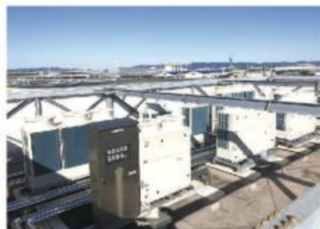
■屋上設置の室外機(更新19系統)

JAあいち経済連の食肉部に属する豊橋ミートセンターでは、優れた衛生管理のもと、取引先ごとの要望に応じたバック肉加工を行っている。JAあいち経済連は、皆さまの食のニーズに対応する高品質な畜産物をお届けするため、集荷から加工まで施設内で行われ肉が外気に触れず衛生的な加工が可能な肉を一貫体制で加工している愛知県内で唯一の事業者である。HACCPに基づき、施設内の定期的な消毒および衛生検査、また、鮮度保持のための温度管理を徹底している。トレーサビリティへの取り組みや確かな製品をお届ける為、製品の品質や食品安全に関するISO認証も取得している。