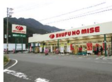
■主婦の店 相賀店 全景

主婦の店相賀店は昭和51年開店で永く地元へ根付いたスーパーマーケットである。主婦の店は三重県に地域密着で展開し、鮮度、旬、本物、おいしさにこだわり、お客様の豊かな「食生活」をサポートする「良質なスーパーマーケット」であり続けることを使命としている。また安心・安全をモットーにたばこはお店では販売しておらず、どうしてもというお客様には自動販売機にて1個単位で買ってもらい、のどに詰まらせると危ないといわれている「こんにゃくゼリー」は取り扱っていない。お客様のサービスカウンターは車いすをお使いの方でも不自由なくご利用いただけるよう全店ゆったりとした造りである。