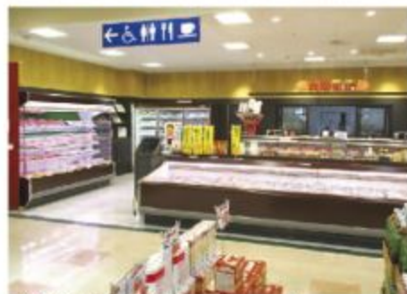
■精肉専門店の丸忠精肉店もリニューアル

大和リーバーサイドタウン Pioはフード&グルメ、ヘルス&ビューティー、ファッション&生活雑貨、サービスの専門店が軒を連ねる郡上市唯一のショッピングモールである。特に人気を集めている大和ストアは生鮮食品を中心に、新鮮・お値打ち品を豊富に取り揃えており特に「鮮魚コーナー」は、日本海の鮮魚を中心に多くの種類を仕入れ、郡上市内はもちろん市外のお客様や飲食店様にも好評を得ている。また精肉店では満足・安心の品質で岐阜県産こだわりの飛騨牛、岐阜ブランド豚肉、地鶏肉、ホルモンなど種類も豊富に並び、「お肉屋さん」ならではの出来立て惣菜も人気である。