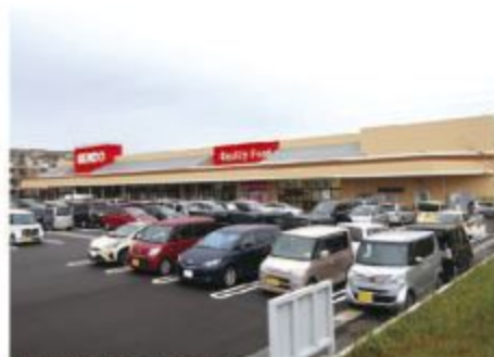
■せんだうちはら台店 全景

せんだうちはら台店は株式会社せんだうの第四号店として平成元年に開店した。『品質の良い商品を・鮮度の良いうちに・まごころの接客で・安く売る』を経営理念に掲げて、生鮮食品を始めとする食品において「品質、鮮度、価格」の3つの重点項目として、常にお客様のニーズを先取りし、地域の皆様に貢献することを心がけている。肉・魚・野菜どれも種類も多く新鮮であるとお客様に大好評で固定客も多い。有人レジとセルフレジと両方ありレジ台数も多く老若男女問わず利用しやすくなっている。