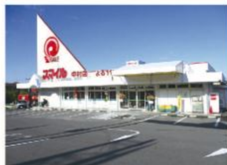
■スマイル 中村店 全景

当日仕入れた食材を当日売り切ることをコンセプトにしており、「いつも新鮮」がモットーのディスカウント型のスーパーマーケットである。そのため、取扱品目を野菜・肉・魚に絞り、市場が休みの日曜・祝日は営業しないというこだわりようである。市場のような雰囲気でも地域の皆様の台所として豊富な食材を用意している。鮮度と安さを求め、開店直前は行列ができる賑わいである。主要なクレジットカードや交通系などの電子マネーでも決済が可能になっており、より快適に買い物できる。