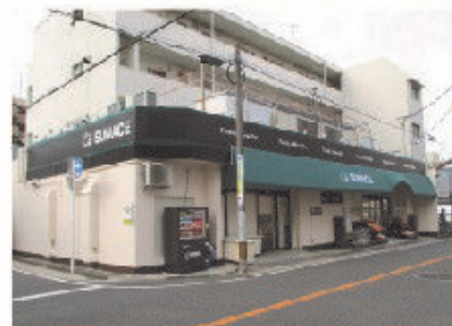
■サンエース 春岡店 全景

サンエースは地元密着型でお客様とのコミュニケーションを大切に、地域社会の健康と長寿に貢献しているスーパーマーケットである。安い・新鮮だけではなく安全な食材を提供することにごこだわりを持っている。今回の春岡店は「えっ?これがサンエース!?」と思ってもらえる様な店を目指し、店舗イメージを一新した。ハード面だけではなく、商品に関しても今までに取り扱っていなかった商品も多数販売するようになり、アイテム数は格段に増えている。高質な商品が増え、店舗の雰囲気も変わったが、今まであったお値打ちな商品も継続して販売している。