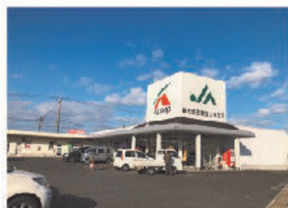
■Aコープ 大高店 全景