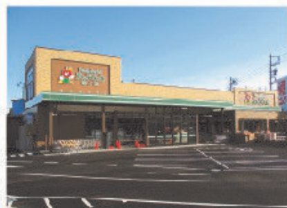
■えぶろん 宮上店 全景

えぶろんフーズは地域密着の市場的な雰囲気イメージした売場づくりをしており、新鮮食品を仕入れたての鮮度でお客様にお届けする為、市場が休みとなる日曜日やお正月が定休日としている。毎日来ていただけるお客様の冷蔵庫代わりの店、あたたかな会話と新鮮な食材あふれるお店を目指し、惣菜も安全・安心・おいしさにこだわり手作りで提供している。お客様の欲しい量だけを提供するという対面バラ売りやインターネットで注文してお客様の自宅へお届けする宅配サービスなど、お客様本位の対応や提案を積極的に行っている。