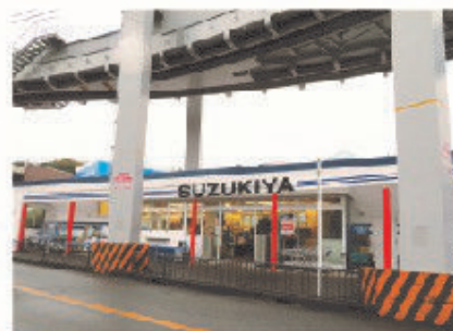
■ スズキヤ 西鎌倉店 全景

湘南モノレール西鎌倉駅下車すぐの場所に位置し自然に囲まれた土地柄で、閑静な住宅街の中にあるお店であり、駅近くにも関わらず入りやすい駐車場もある。高品質で、安心、安全、美味しいをモットーに小さなお店ながら溢れんばかりの商品を多数取り揃えており、大手スーパーでは扱っていない鎌倉ならではの地元ブランド食品や他にはない厳選された珍しい食品も扱っている。パンやお惣菜コーナーは充実しており、特にお弁当は大好評である。さらに店員の対応が良いとのことお客様の声も多い。