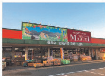
■マルエイ 横島店 全景

お客様の毎日の「豊かな食生活」のお役に立てるよう努力しているお店である。お客様の安心・安全を最優先し、良質で美味しいものを安く提供できるように力を尽くしている。地元産地とお客様の食卓をつなぐ「地産地消」の取り組みで互いの理解を深め、土地の食文化・食料自給率・地域全体の活性化の可能性を高めたいと考え、地域の生産者の方が大切に育てた、新鮮な旬の農産品をはじめとする安心できる食材を届けている。またお客様との会話を大事にして挙がった要望を店舗に反映させお客様が気持ちよく買い物していただけるような売り場づくりをしている。