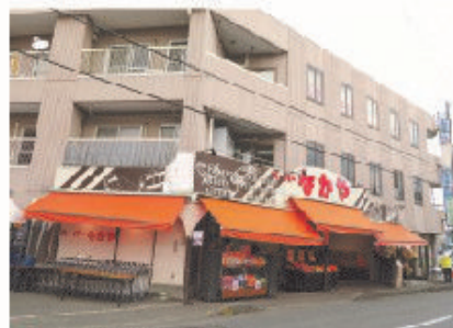
■スーパーなかや 海老名店 全景

1958年(昭和33年)創業以来“商いを通じて地域のお客様に信頼され、地域社会に貢献できる”を経営理念にしている。「お客様からの信頼」「お客様への貢献」をより大切に、お客様の冷蔵庫がわりに店舗を利用して頂けるよう、圧倒的な「鮮度」「品質」「安さ」を追求し、心地よい笑顔と元気で地域を明るくする企業を目指している。生鮮食品の中でも鮮魚は安くて新鮮で美味しいと来店するリピーターのお客が多く、地域1番の鮮魚部門を構える生鮮特化型スーパーとして店づくりを行っている。Paypayでの支払いもできる。