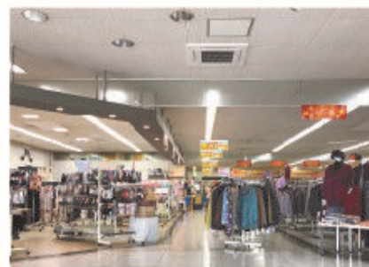
■ SC全体の照明・空調もリニューアル

甲佐町は熊本県のほぼ中央部に位置し、「粘のやな場」に代表される、水と緑の自然豊かな町である。店舗は、ドラッグストア・衣料品・クリーニング・ベーカリー・ATM等、日々の生活に欠かせない商品とサービスを取り揃え、地域のお客様とのふれあいを大切に、親近感あふれるお店づくりを心掛けている。特に毎週日曜日の朝市は、新鮮で高品質な生鮮品を中心にお手頃価格で提供し、毎回多くの行列ができる盛況ぶりである。駐車場も広く完備しており昭和52年の開店以来、これからも地域に欠かせない、お客様に永く愛されるお店を目指している。