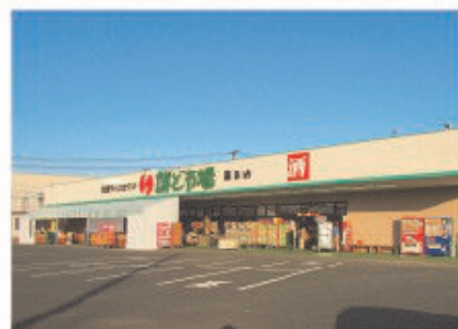
■鮮ど市場 嘉島店 全景

鮮ど市場は「いつも新鮮」がモットーのスーパーマーケットで、当日仕入れた食材を当日売り切ることをコンセプトにしているため、市場が休みの日曜・祝日は営業していない。「鮮ど市場」の店名通り、生鮮食品はいつも新鮮で安く手に入るが、当日売り切りのため、夕方からは値引きシールが貼られさらにお買い得である。生鮮食品を買うときは「鮮ど市場」というお客様も多くいる。旬の食材がお手頃価格で一通り揃うのも魅力のひとつだ。また惣菜も人気である。電子マネーも使用できるようになり会計もスムーズに済ませることができる。