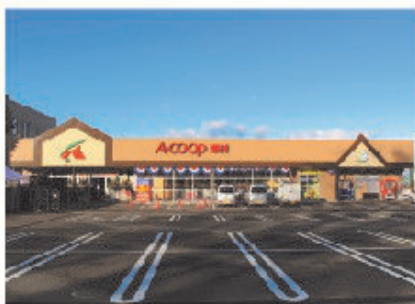
■ A・コープ 原村店 全景

株式会社長野県A・コープは、地元産・県産・国産の商品を最優先で品揃えし、「新鮮・安全・安心・健康」にこだわり、JAならではの生産者と消費者が触れ合える地域密着型の店づくりを目指している。A・コープ原村店は、八ヶ岳山麓標高1000mに位置し、蓼科、白樺湖、霧ヶ峰にも近く四季の自然が満喫できるベジタブルランド原村と呼ばれている場所にある。文字どおり高原野菜が豊富で、地元生産者が育てた新鮮な朝採り野菜の直売コーナーは人気が高く、原村で唯一無二のスーパーマーケットとして食品等の提供を行っている。