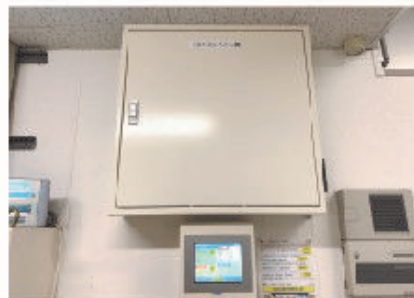
■アリガEMS制御主装置と監視モニター

今年度は同じくエネマネ事業を活用し「大佐野店」のリニューアルも実施。両店ともお店を休まずリニューアルできた事業である。