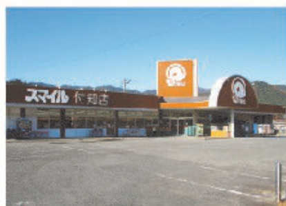
■スマイル付知店 全景

鳥取県米子市にあるAコープ大高店は、高速のインターから5分ほどの辺りに位置している。気候風土を活かした地場産の野菜を多く取り揃えており、「安くて新鮮でおいしい」と地元の人からの声も多い。大山山麓に降り注ぐ雨や雪は、数百年の時を経て豊富な伏流水となり、JA鳥取西部管内の水田すべてが、この水によって潤され美味しい米がつけられている。また新鮮な野菜は大自然のきれいな水・空気・土壌でつくり、そして何よりも生産者の愛情が注ぎ込まれている。そのような地場の農畜産物が並んでいる。また海も近く、イカやカニ・新鮮な海鮮が豊富に顔を揃えている。他のスーパーには出ないような珍しい食材も並ぶこともある。