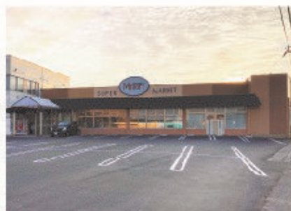
■ M mart(エム・マート)(全日食) 全景

鳥取県西伯郡大山町にあるエム・マートは、中国地方最高峰である大山のふもとにあり山と海、大変自然豊かな場所に位置する。地域密着型で、地元でとれた新鮮野菜や海鮮はもちろん、各種食料品、100円均一コーナーもある便利なスーパーマーケットである。特に惣菜コーナーでは、人気の茶碗蒸しをはじめとする地元食材を活用した惣菜などプライベートブランド商品として、さまざまな惣菜をお手頃価格で販売している。また新たに新設されたパンコーナーでは、焼立てのパンが並んでいる。常に地域の方々が求められていることを考え、地域の方々が喜んでくれるようなお店づくりを目指している。