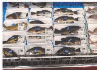
■能登沖で獲れた地もの新鮮魚介が並ぶ

全日食フードはまおかは、石川県 能登半島の先端、珠洲市(すずし)にある食品スーパーである。日本海 能登半島沖といえば暖流(対馬海流)と寒流(リマン海流)がぶつかる最高の漁場と呼ばれている。その風土と特徴を活かし、新鮮な日本海の海の幸を豊富に取り揃え、他では見ることができない珍しい海産物が多く店頭に並んでいる。また、北陸産や能登産の食材を中心に、加工食品や調味料、お菓子など様々な商品を取り揃えており、地元の人だけではなく、遠方からくるお客様も楽しめるような売場になっている。