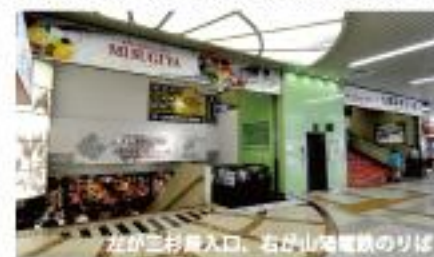
左が三杉屋入口、右が山陽電鉄のりば

今回ご紹介する三杉屋山陽明石店は、その明石駅の駅ナカという特徴ある場所で営業している。同店舗を運営する(株)三杉屋はスーパーマーケット11店舗、青果専門店は13店舗展開し、今年創業20周年を迎える気鋭のチェーンだが、駅ナカに出店するのはこの山陽明石店が初めてだった。開店当初はお買い得な目玉商品を山積みしても売れず、チラシを入れても集客がままならないという状況だったという。そんな時に参考としたの