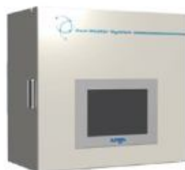
当社開発の冷蔵設備省エネシステム「エコマスター」を導入。

今回は補正予算での補助金であったため、補助率が2/3と大きな補助率となり、投資効果の高い事業となりました。