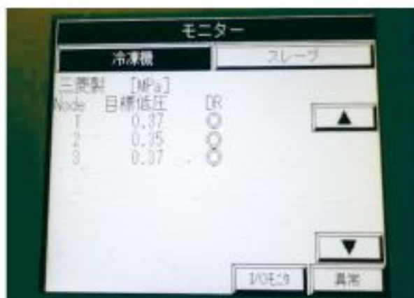
■冷蔵ショーケースの省エネシステム画面

「株式会社サンモール」は、昨年の桜町店に続き、二度目の省エネ補助金活用で「サンモール水上店」のリニューアルを実施。水上店がある「みなかみ町」は、群馬県最北端に位置し、水上温泉郷や猿ヶ京温泉などの温泉が多数あり、また、谷川岳など自然豊かな山々がある利根川源流の町である。その中で地域密着のスーパーマーケットとして「サンモール水上店」は、お客様にとって、なくてはならない店となっている。