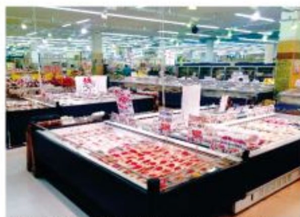
■安さの演出に必要な、平型ケースを多用している

「パワーセンターうおかつ」を運営する「株式会社カルチャー」は、群馬県高崎市を中心に5店舗を運営している地域密着のスーパーマーケットである。「豊富な品揃え」と「鮮度」、そして、特に「お値打ち価格」での販売で多くのお客様から支持されている。省エネ対策と電気代の削減を進める為、補助金活用でリニューアルを実施。今回の倉賀野店は、一昨年の樓名店に続き、2度目の省エネ補助金活用となる。