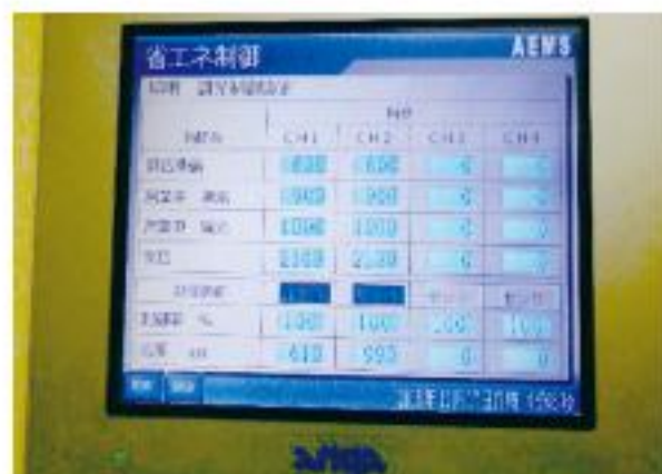
■省エネシステムのEMS表示・設定機器

「ビバ甲子園協同組合」は、高校球児があこがれる甲子園球場の近くにあり、組合組織で運営しているスーパーマーケットである。22年前の阪神・淡路大震災でそれまで営業していた木造の市場は全壊したものの、若手商店主たちが中心となり協同組合を設立し、誕生したのが現在の「ビバこうしえん」である。今回、店舗全体での省エネを進める為「エネルギー使用合理化等事業者支援補助金」を活用し、全面リニューアルを実施。