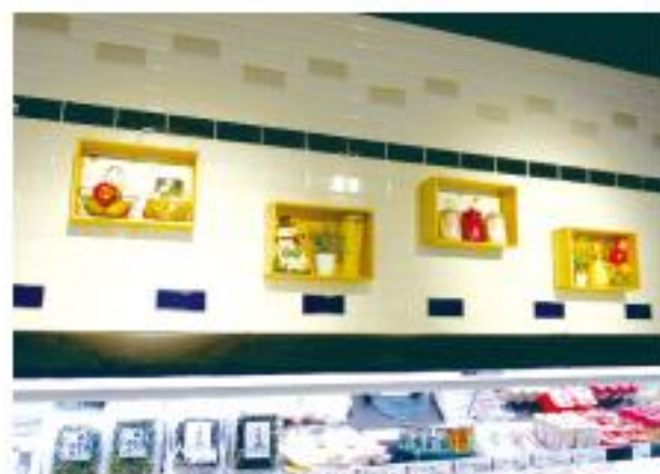
■社長自ら考え、壁面装飾を制作

「株式会社ベルマートいいだ」がある舞鶴市は、京都府北部の日本海に面した都市で、自然豊かな海や山、そして海上自衛隊基地や、ユネスコ世界遺産に登録された旧海軍施設等があり、自然と文化に満たされた町である。その中で、「旬工房食品館」は大手に負けない「品質とこだわり」が多くのお客様に評価されてきた。今回は、一層の店舗充実を図る為、「エネルギー使用合理化等事業者支援補助金」を活用し、省エネと全面リニューアルを実施。