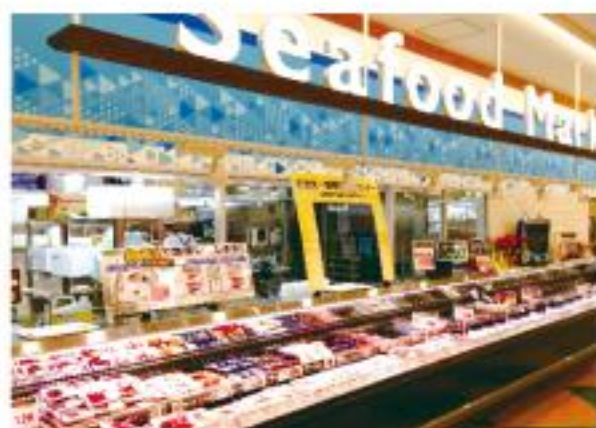
■各コーナーはセンス良く、カラーコントロール

「株式会社ヤスサキ」は、福井県内を中心にスーパーマーケット・ホームセンター等のショッピングセンターを展開する県内有数の企業である。今回「エネルギー使用合理化等事業者支援補助金」を活用し、リニューアルを実施した「ヤスサキ新保店(ワイプラザ)」(店舗面積 A館6,264㎡ B館10,176㎡)は、郊外型ショッピングセンターとして、「食品スーパー」「ファッション専門店」「ホームセンター」等で構成する『ヤスサキグループ』の戦略的店舗である。