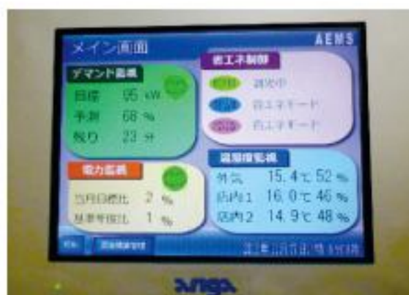
■省エネシステムのEMS表示・設定機器

「株式会社主婦の店」は、前記の「セントラルマーケット」も合わせ6店舗を展開しているが、今回、28年度の「エネルギー使用合理化等事業者支援補助金」を活用して、リニューアルを実施したのがこの「長島店」だ。省エネ補助金については、平成23年1月リニューアル実施の「サンパースト」(削減率40%を達成)、また、27年度補正の「中小企業等の省エネ・生産性革命投資促進事業費補助金」において、「セントラルマーケット」の照明を「全LED化」しており、「CO2削減」と「省エネ化」に積極的に取り組んでいる。